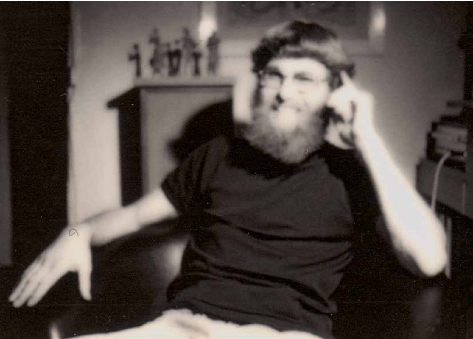
Bäckereiweg 18 Mai 1970