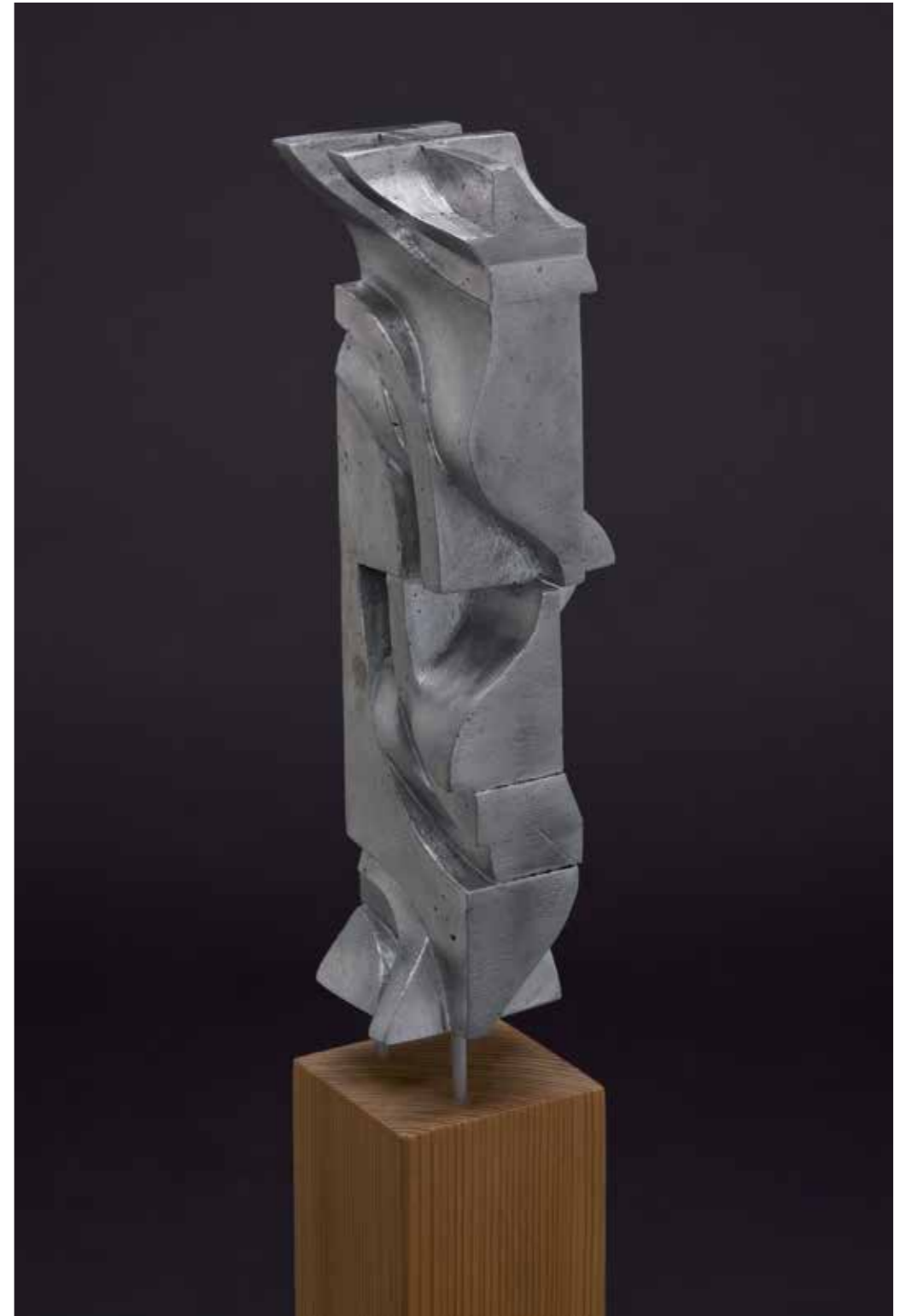
Abbildung auf der Einladungskarte Ausstellungen 2013 Worb, Gemeindehaus und Bank SLM

Besitz: Andy Spöhel und Lise Geiser, Worb